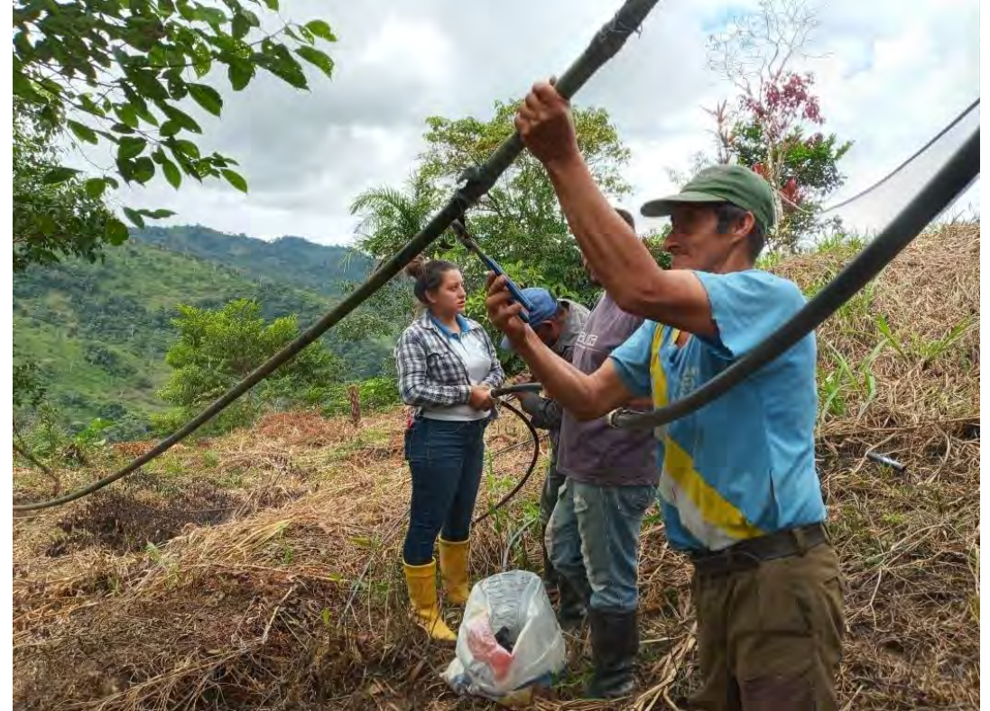
MINGA COMUNITARIA DE MEJORAMIENTO DEL SISTEMA DE AGUA POTABLE SECTOR BARRO NEGRO