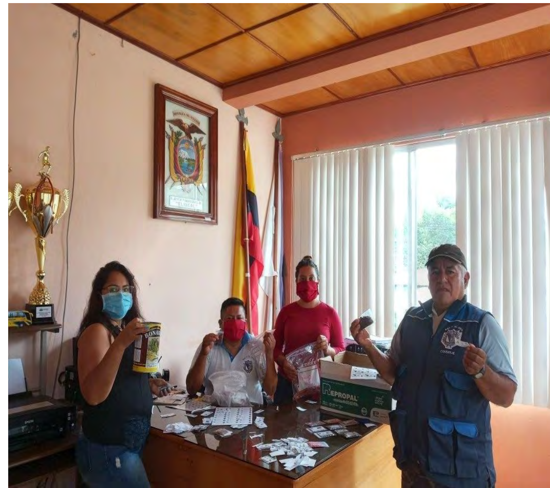
Entrega de kits de semillas de hortalizas