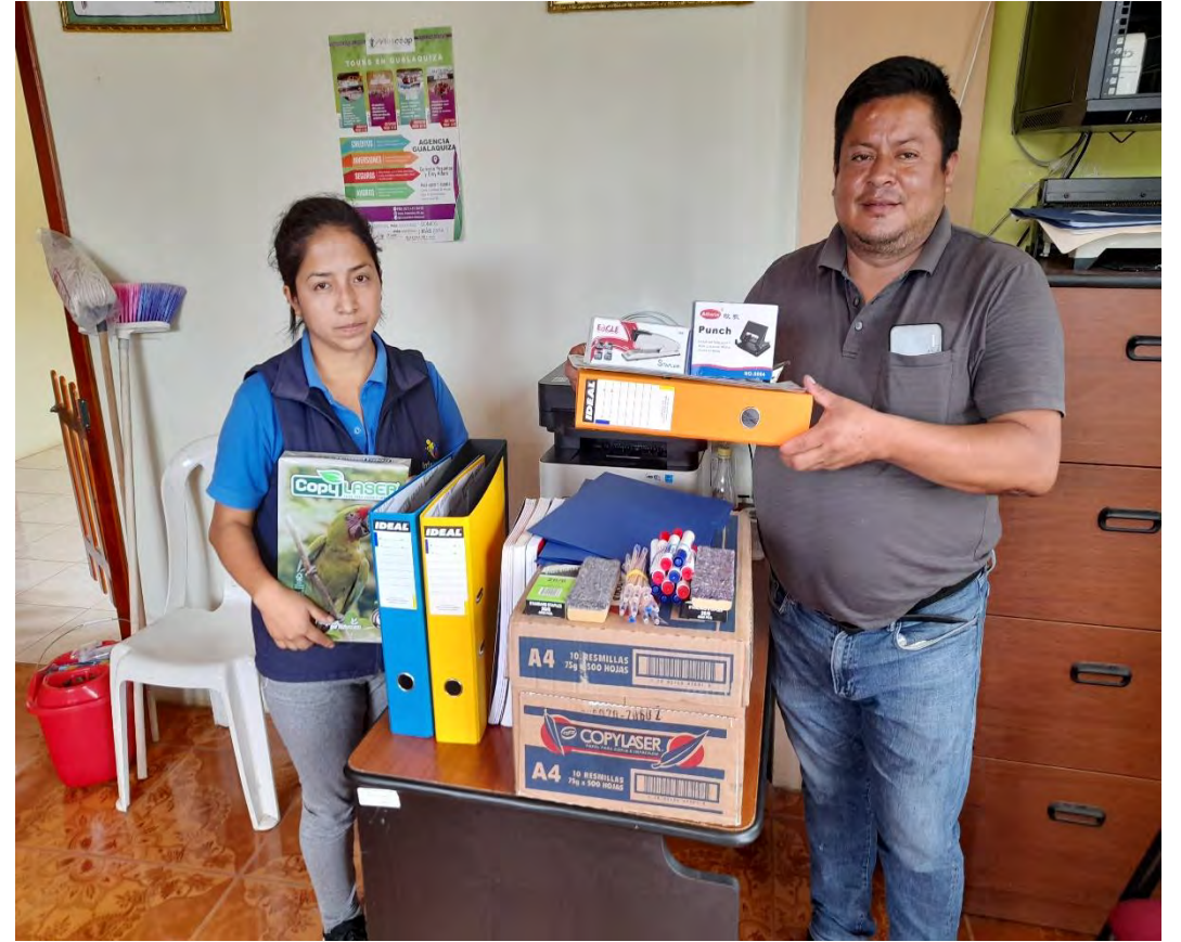
ENTREGA DE MATERIALES DE ASEO Y DE OFICINA AL INFOCENTRO