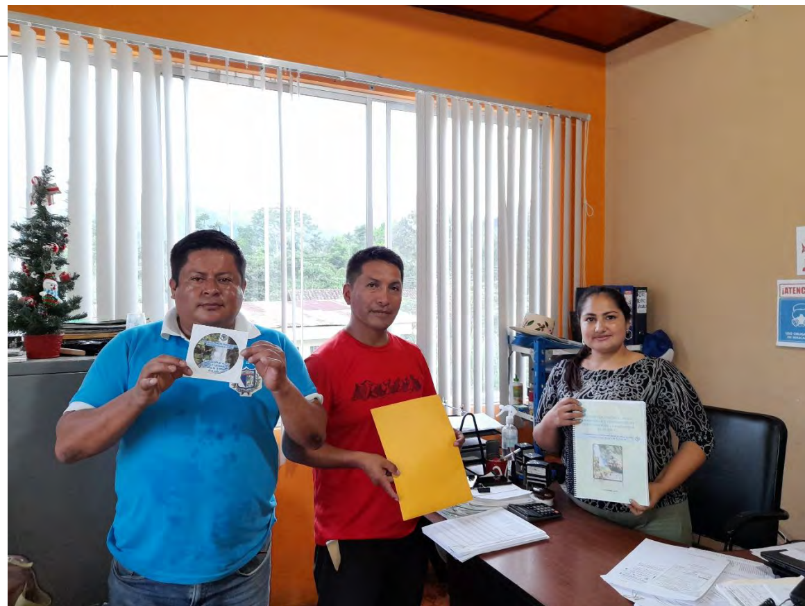
ELABORACIÓN DEL PDOT DEL GAD PARROQUIAL DE EL IDEAL