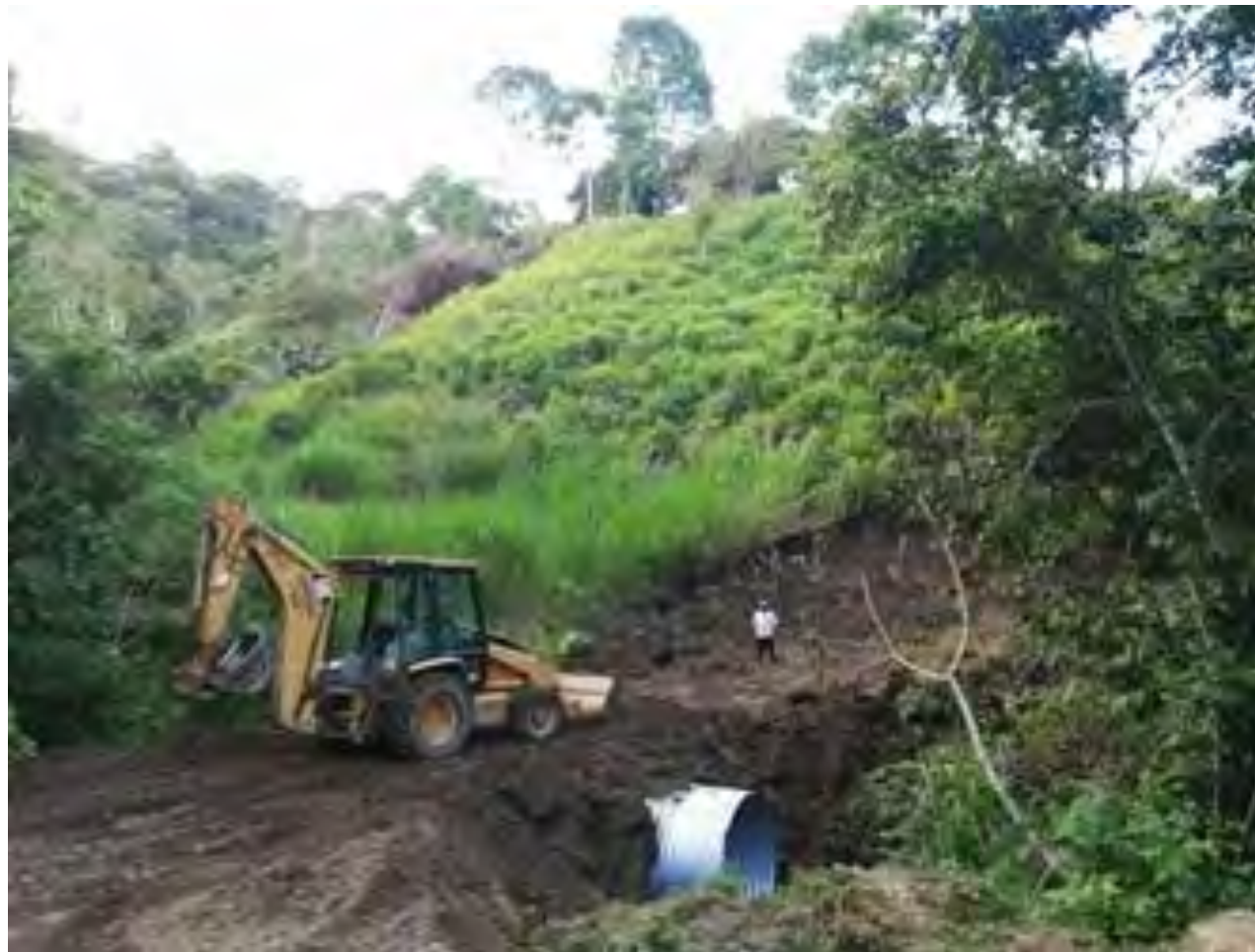
ARMADO Y COLOCACIÓN DE ALCANTARILLA, EN LA QUEBRADA NUEVA ZARUMA