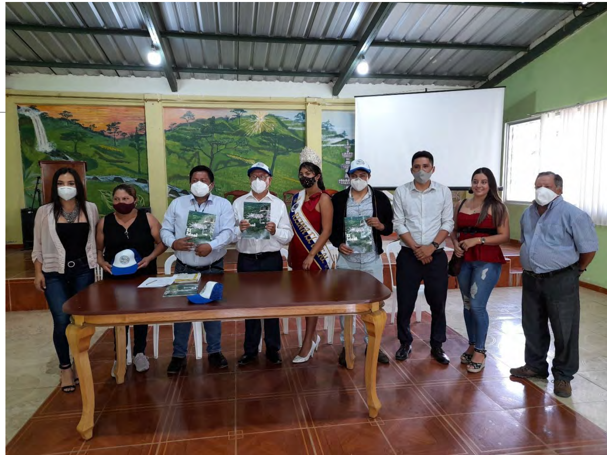
GESTION DE TRABAJO CON EL GOBERNADOR PROVINCIAL