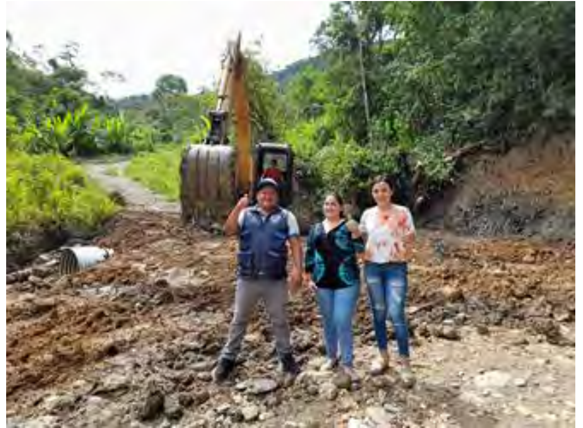
ALQUILER DE MAQUINARIA PARA LA COLOCACIÓN DE ALCANTARILLA Y MANTENIMIENTO DE LA VÍA, SECTOR EL TRIUNFO