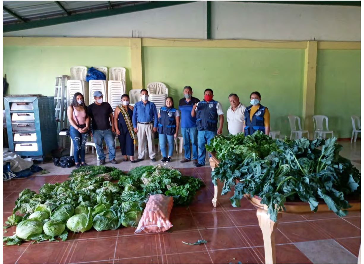
ASISTENCIA ALIMENTARIA A LAS PERSONAS VULNERABLES