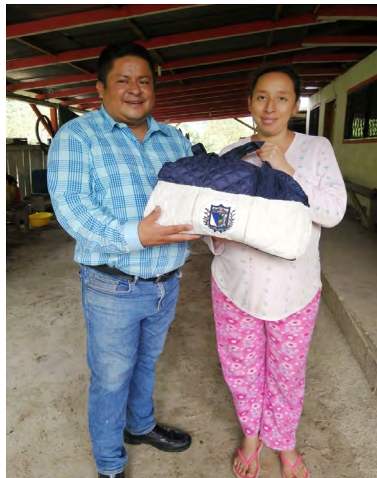
ENTREGA DE PAÑALERA