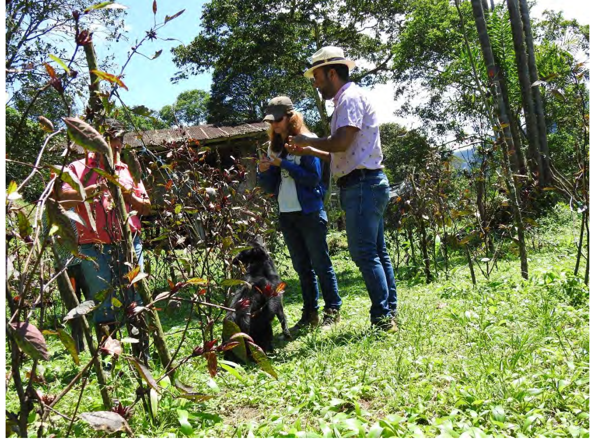
EMPRENDIMIENTO DE PRODUCCIÓN DE JAMAICA