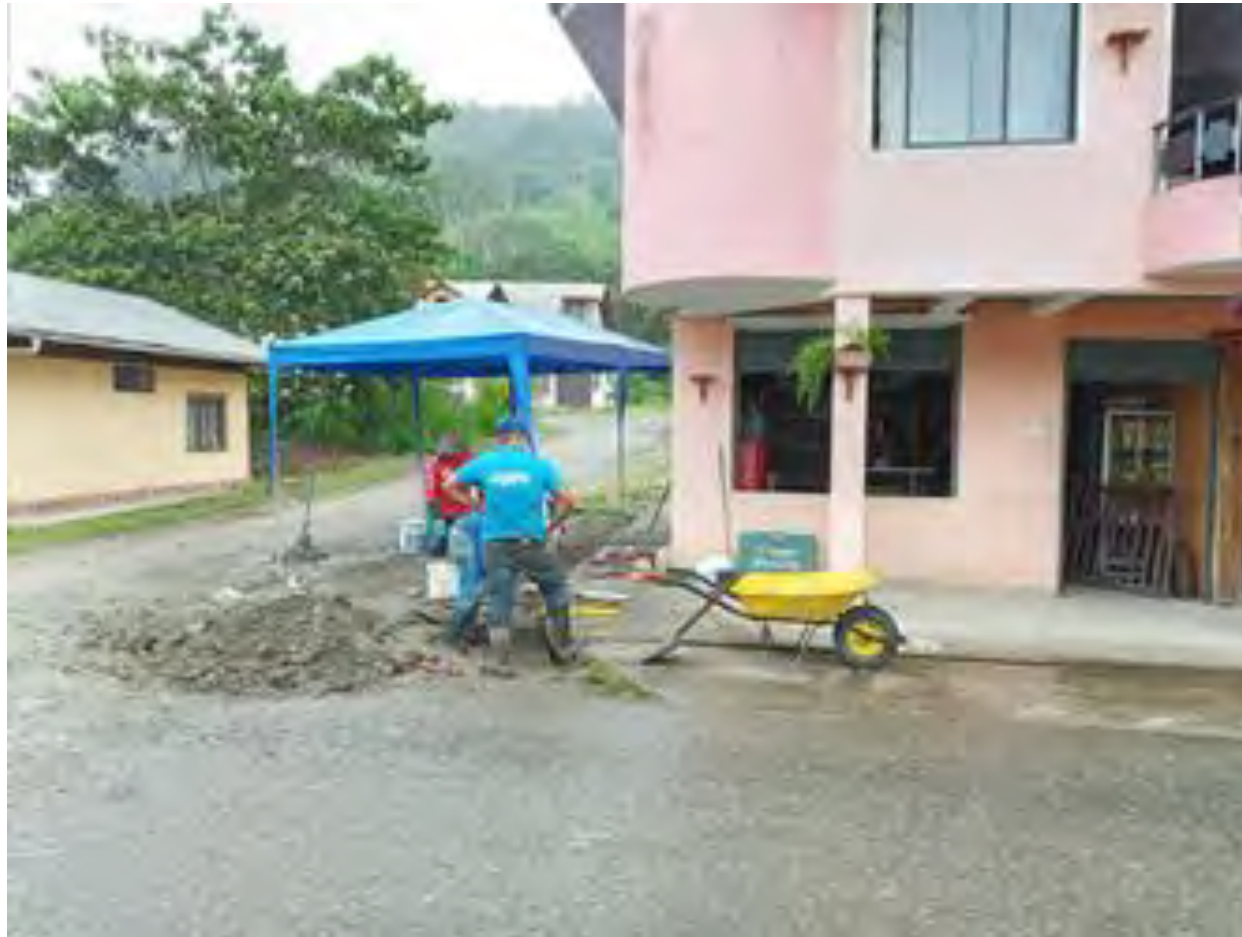
REPARACIÓN DE SUMIDEROS EN LA CABECERA PARROQUIAL