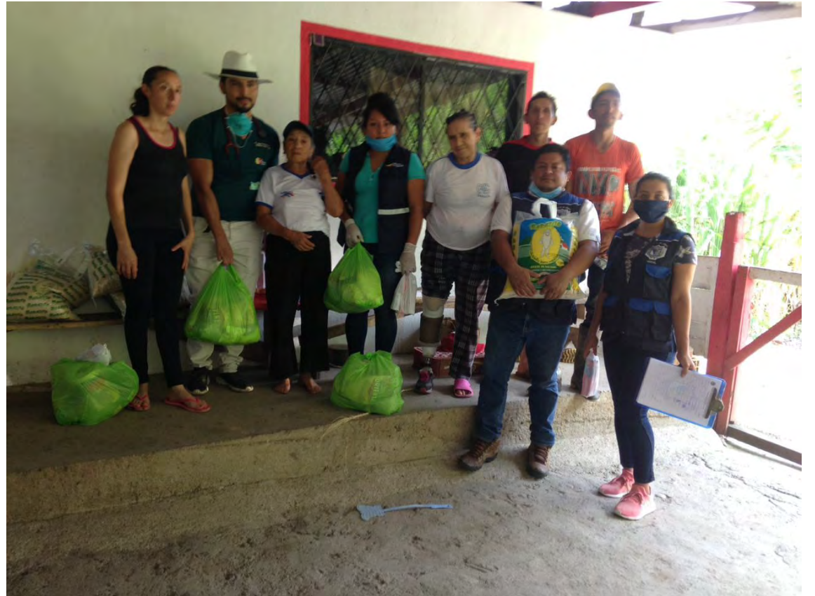
AYUDA HUMANITARIA A LAS PERSONAS VULNERABLES