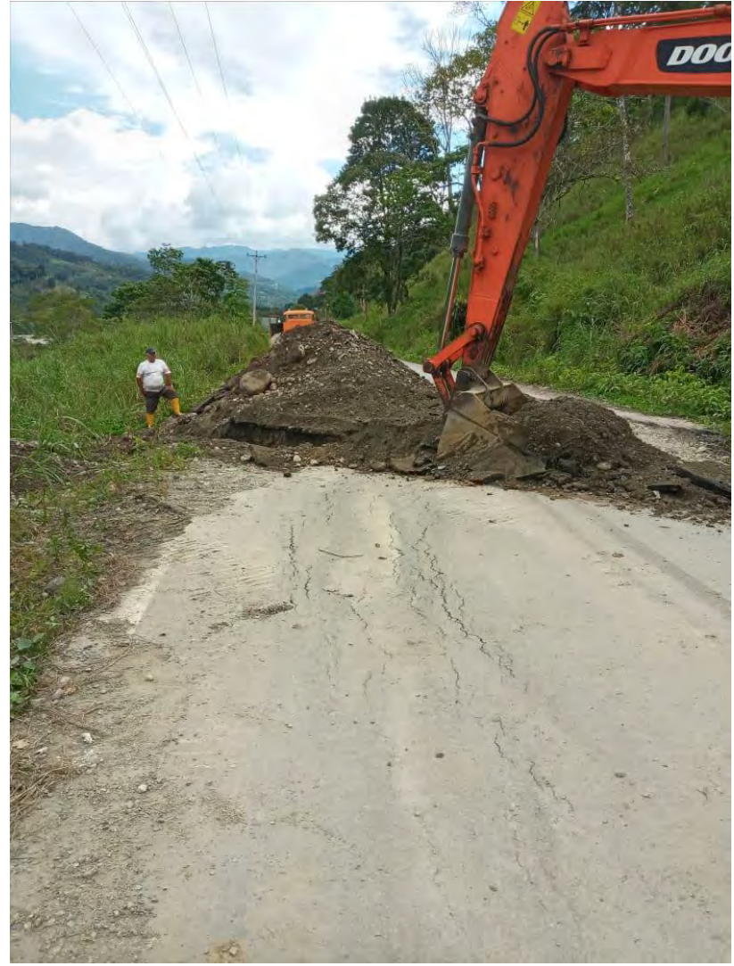
DRENAJE Y MANTENIMIENTO DE TRAMOS DE LA VÍA SECTOR SANTA ROSA