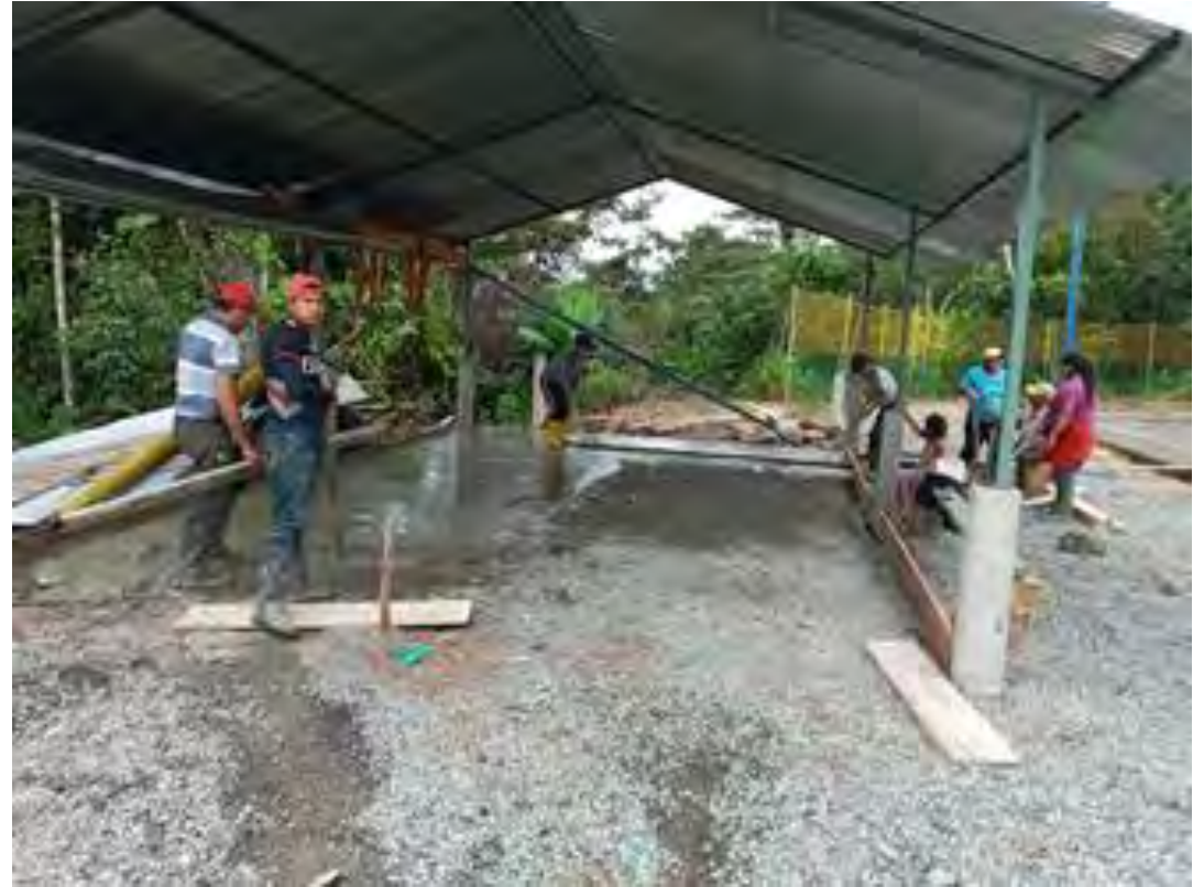
MEJORAMIENTO DEL ESPACIO DEL BAR SECTOR BARRO NEGRO