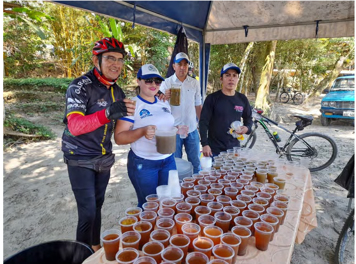
CICLO RUTA DEL MANIGULLAN