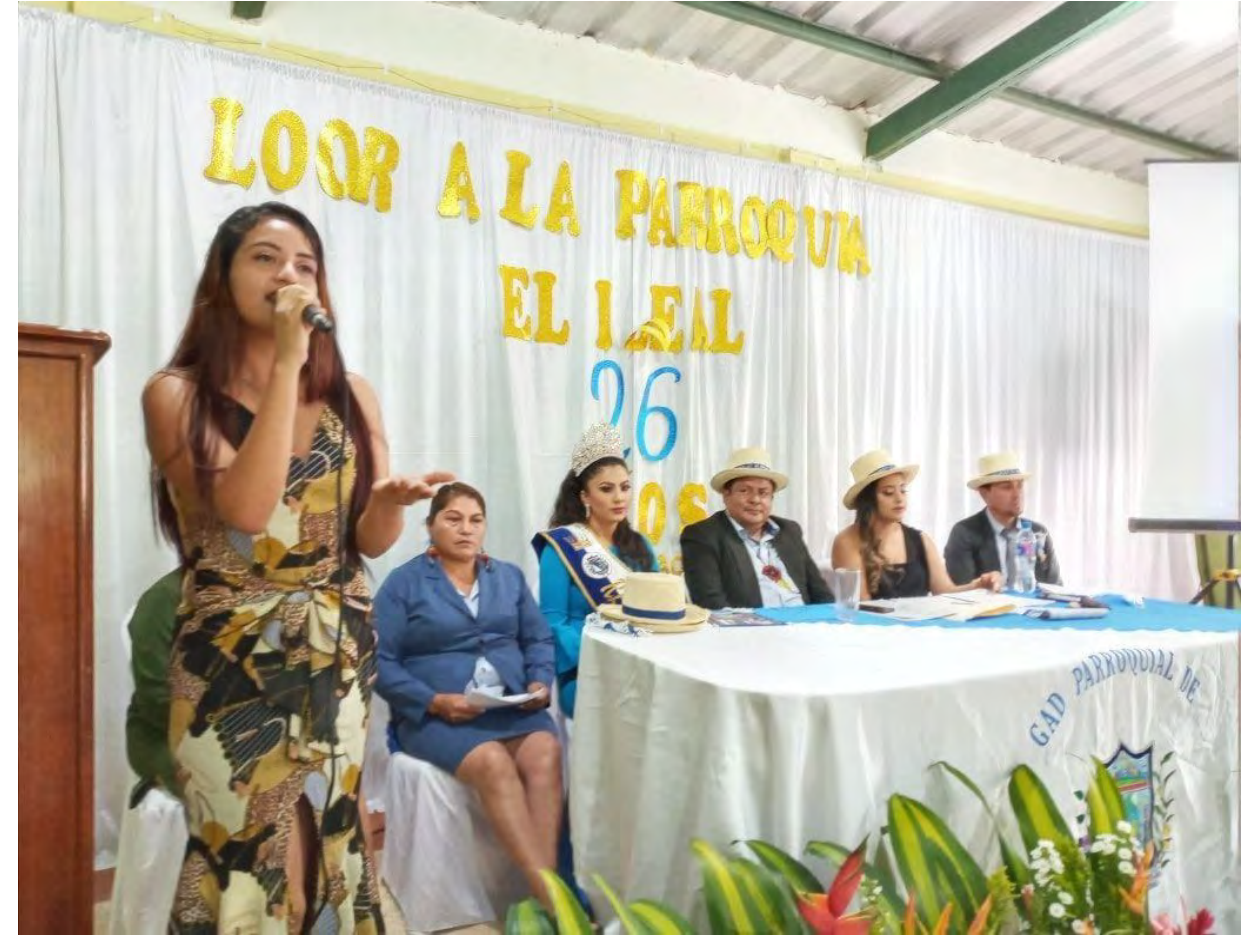
SESIÓN SOLEMNE DE ANIVERSARIO DE PARROQUIALIZACIÓN DE EL IDEAL