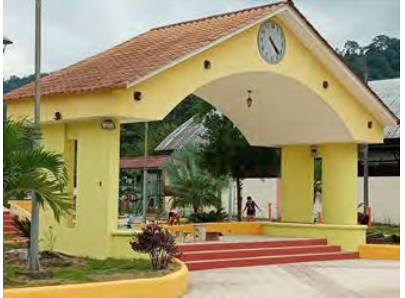
ADECENTAMIENTO DEL PARQUE CENTRAL