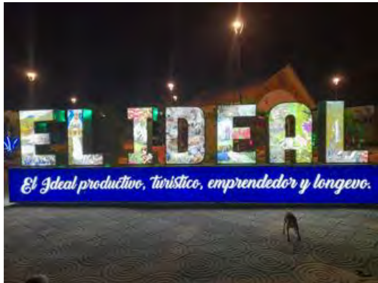
COLOCACIÓN DE LETRAS TURÍSTICAS