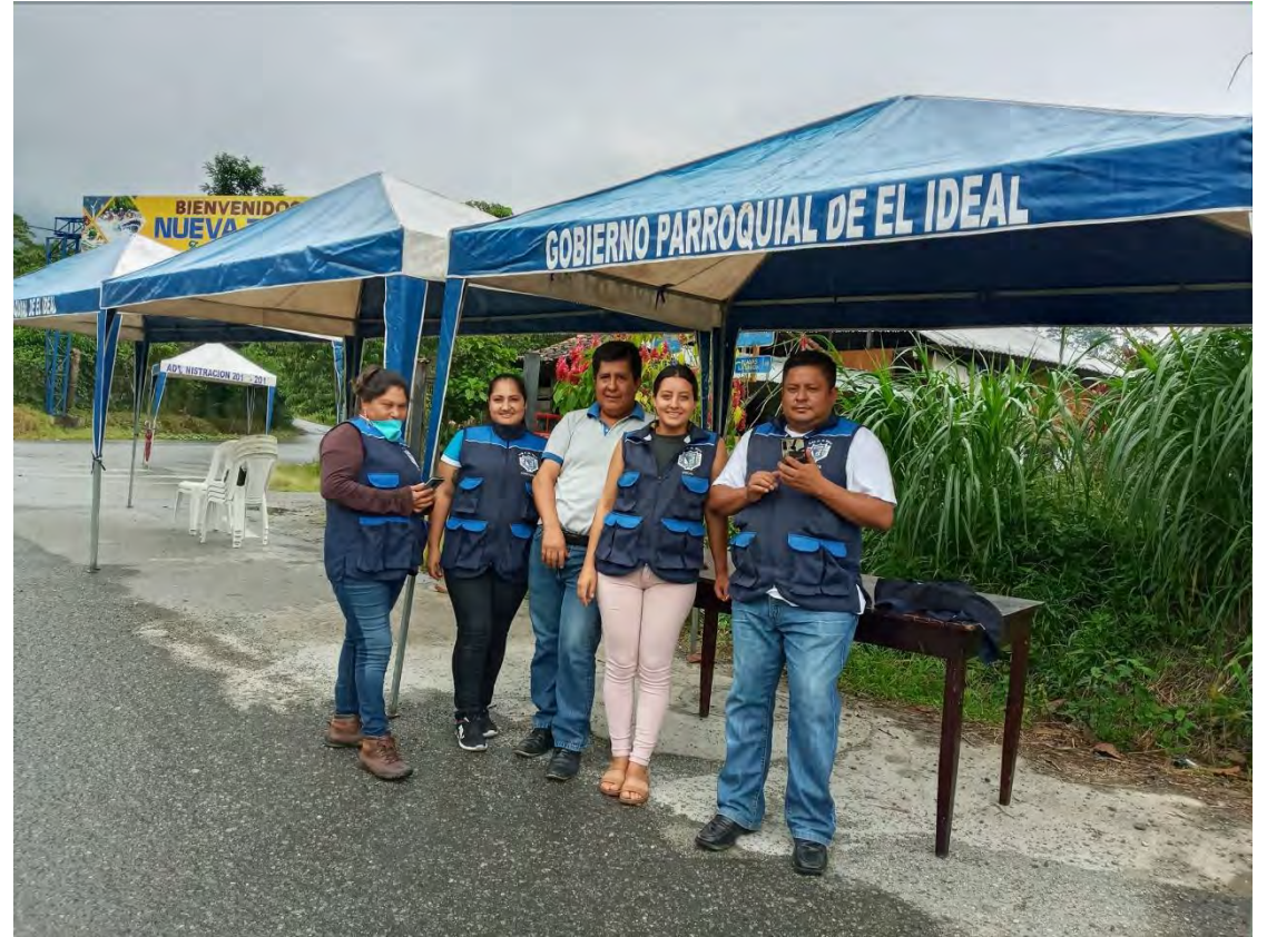
COPAE EL IDEAL