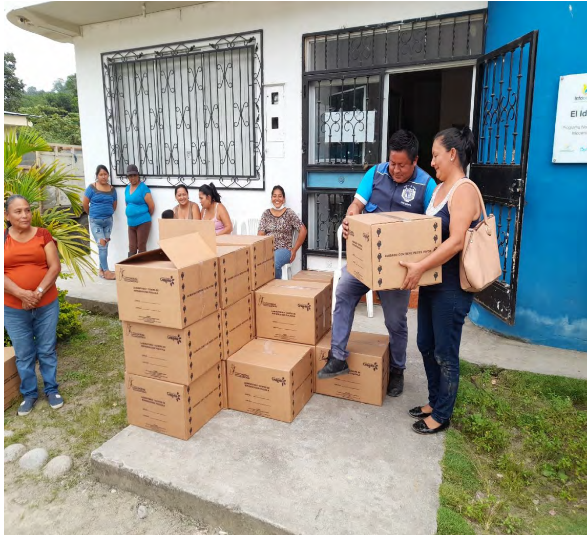
ENTREGA DE ALEVINES