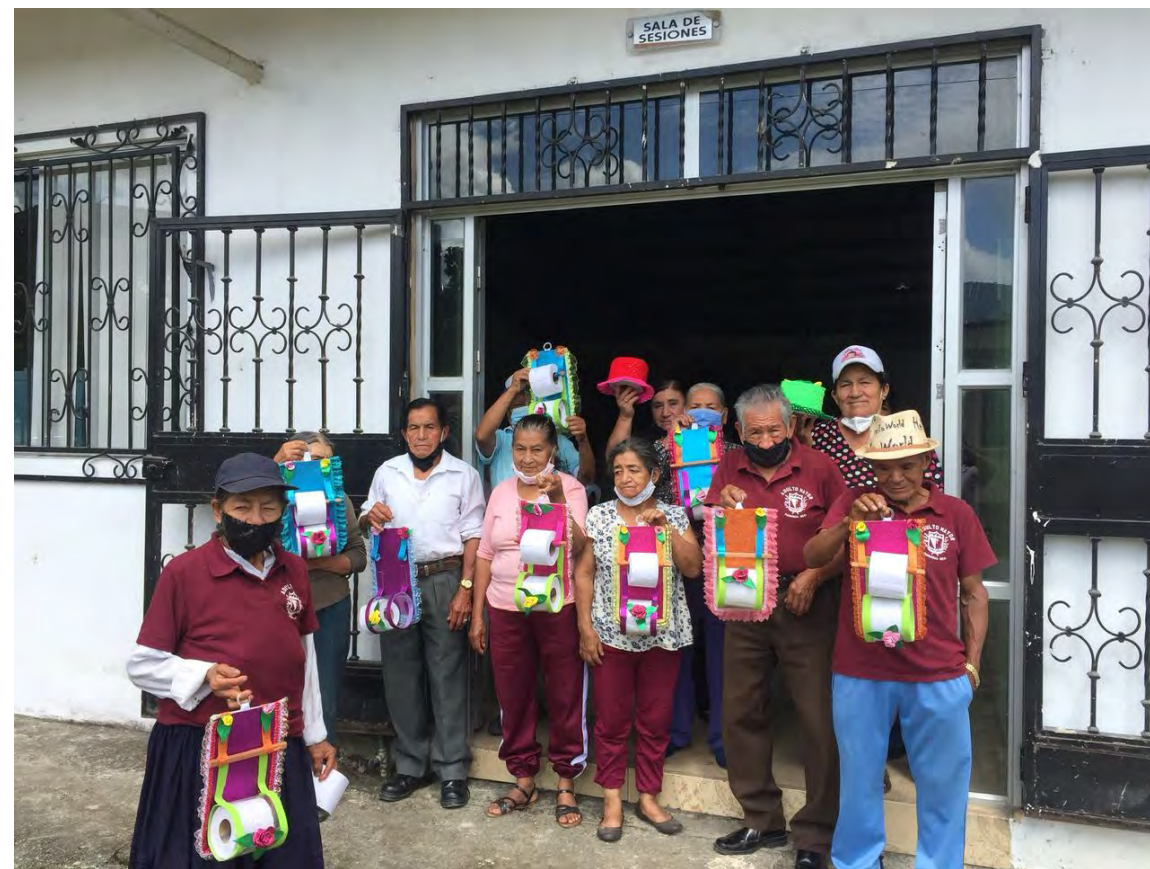
ESCUELITA DEL ADULTO MAYOR